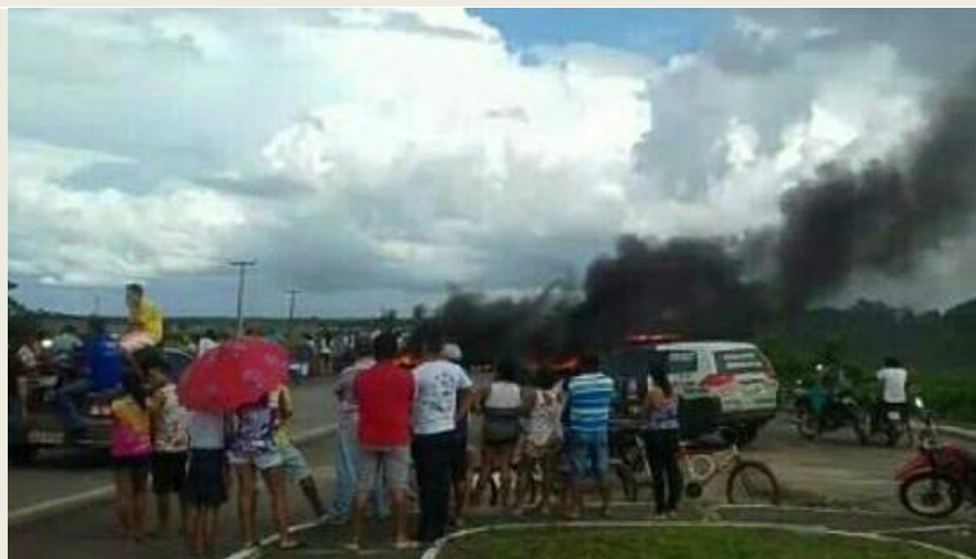
Estudantes voltaram a atear fogo em pneus e em pedaços de madeira para bloquear rodovia

Deputado Wellington repercute segundo dia de protesto de estudantes em Maranhãozinho