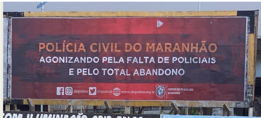
Outdoor exibe mensagem de protesto do Sindicato dos Policiais Cíveis