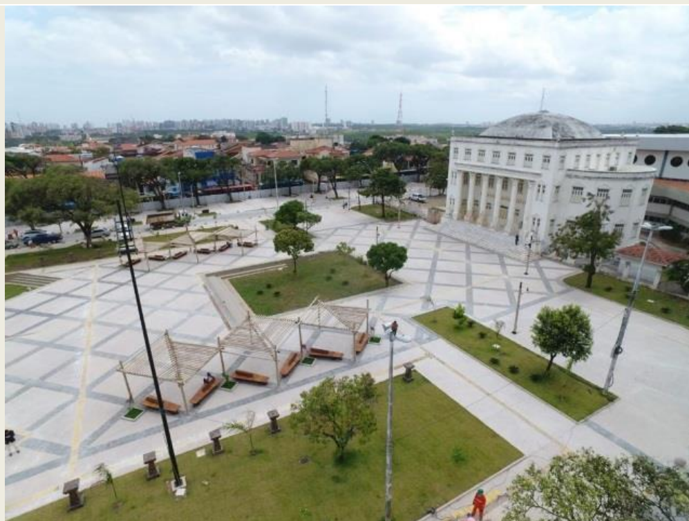
Vista érea do complexo Deodoro/Pantheon, reinaugurado recentemente, após requalificação urbanística