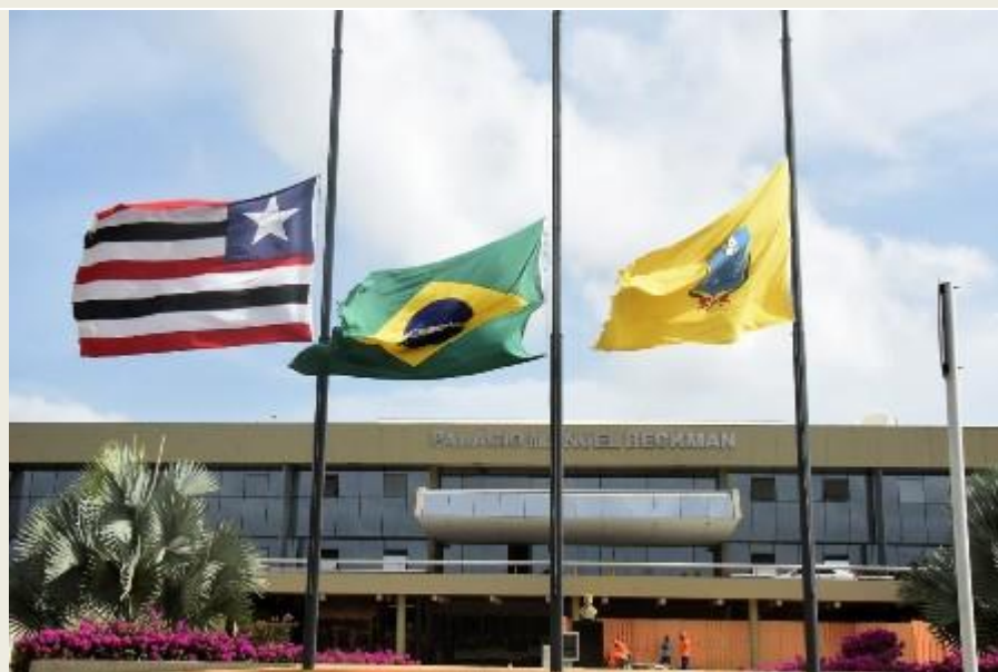
Palácio Manuel Beckman, sede da Assembleia Legislativa do Maranhão

Assembleia lança campanha institucional contra assédio, violência e feminicídio