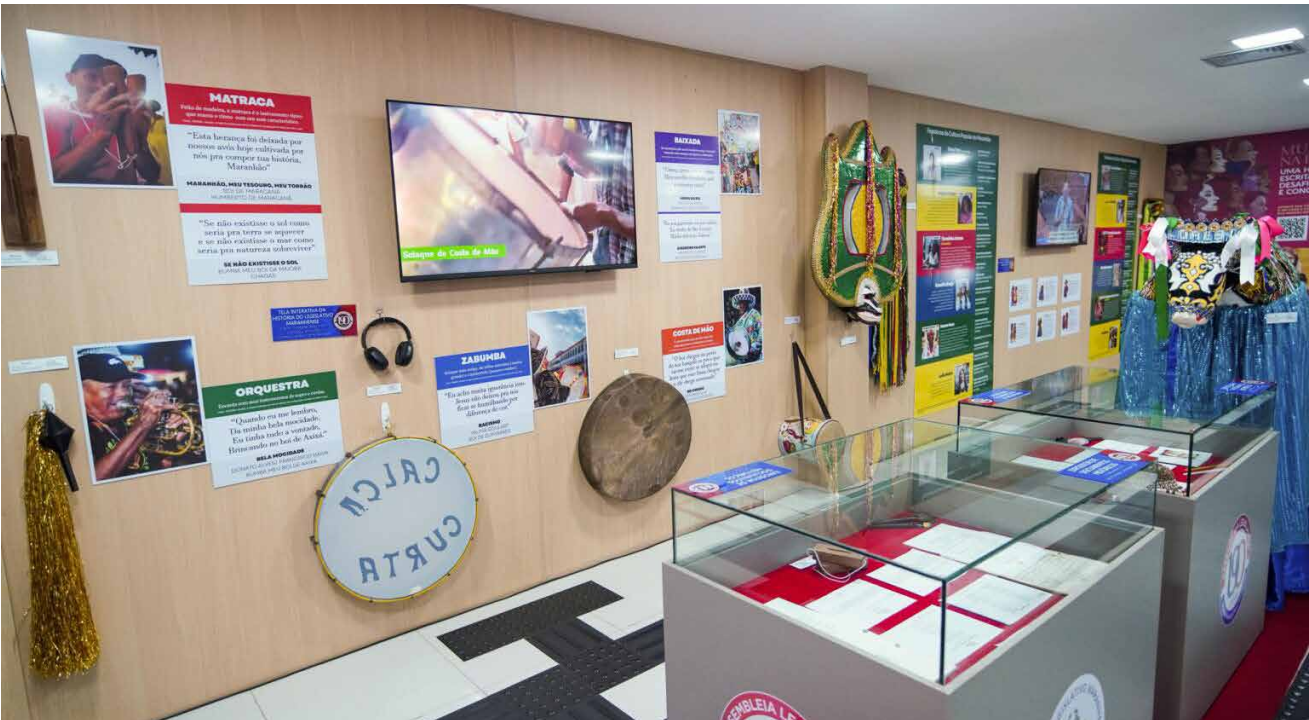
Exposição Leis e Sotaquesdo Povo Maranhense, no Memorial Zuleide Bogéa, na Alema