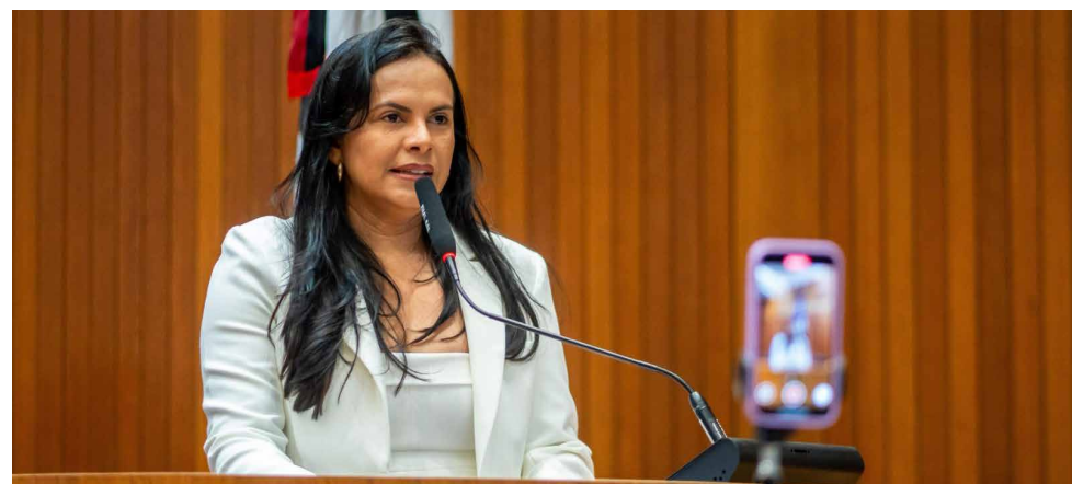
Deputada Ana do Gás destacou os avanços do Maranhão na área do gás natural

De acordo com Ana do Gás, o governador tem sido incansável na busca de investimentos para o Estado.