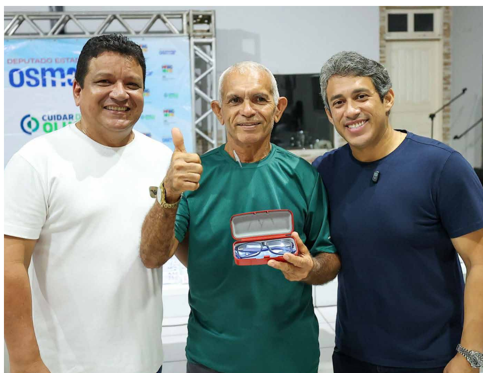
Deputado Osmar Filho entrega óculos a participantes do mutirão em São José de Ribamar

O deputado estadual Osmar Filho (PDT) realizou mais uma entrega de óculos do programa Cuidar dos Olhos, no município de São José de Ribamar, Região Metropolitana de São Luís. No evento, que reuniu centenas de pessoas, o parlamentar destacou o compromisso do seu mandato com a saúde e a qualidade de vida da população maranhense.