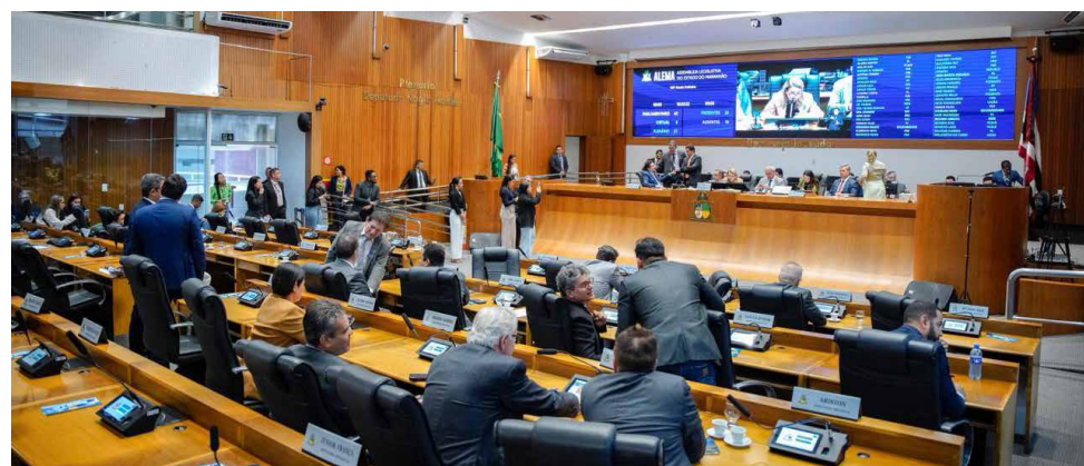
Plenário aprovou o PL que dispõe sobre a instituição do Programa Estadual de Alimentação Escolar

A Assembleia Legislativa aprovou o Projeto de Lei 409/2025, de iniciativa do Poder Executivo, que dispõe sobre a instituição do Programa Estadual de Alimentação Escolar – “Refeição de Verdade”. O objetivo é fortalecer a política de alimentação nas escolas,