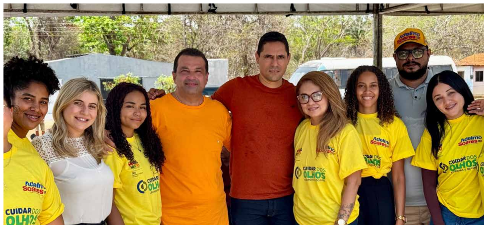
Deputado Adelmo Soares e profissionais que atuaram no Mutirão da Saúde e Beleza no município

A população de São João do Sóter foi beneficiada com mais uma importante iniciativa do deputado estadual Adelmo Soares (PSB). Em parceria com o Governo do Estado do Maranhão, por meio do governador Carlos Brandão (PSB), e com o vereador Wenderson Pinto, o parlamentar realizou o Mutirão de Saúde e Beleza, que ofereceu