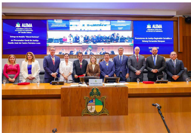
Sessão solene em homenagem a membros do Ministério Público do Maranhão, realizada na Alema