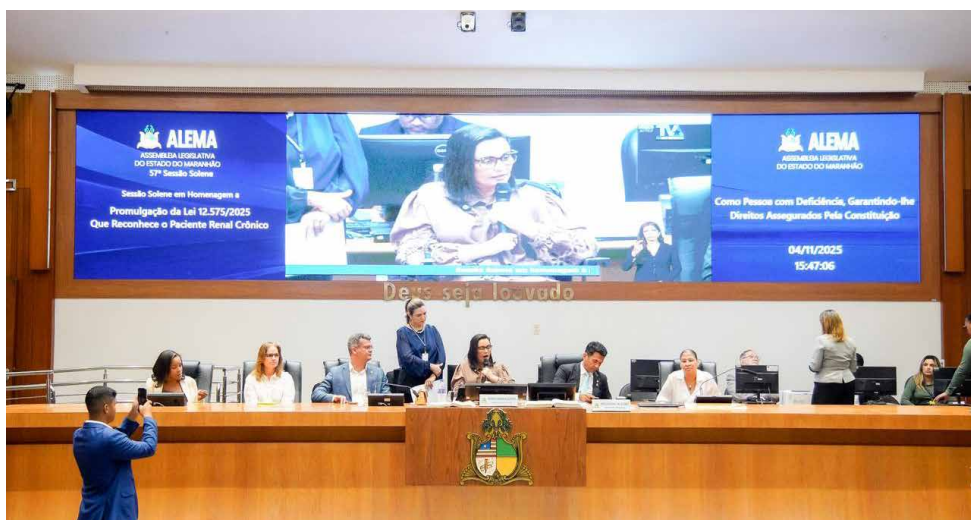
Solenidade em comemoração à promulgação de lei que reconhece paciente renal crônico como PcD