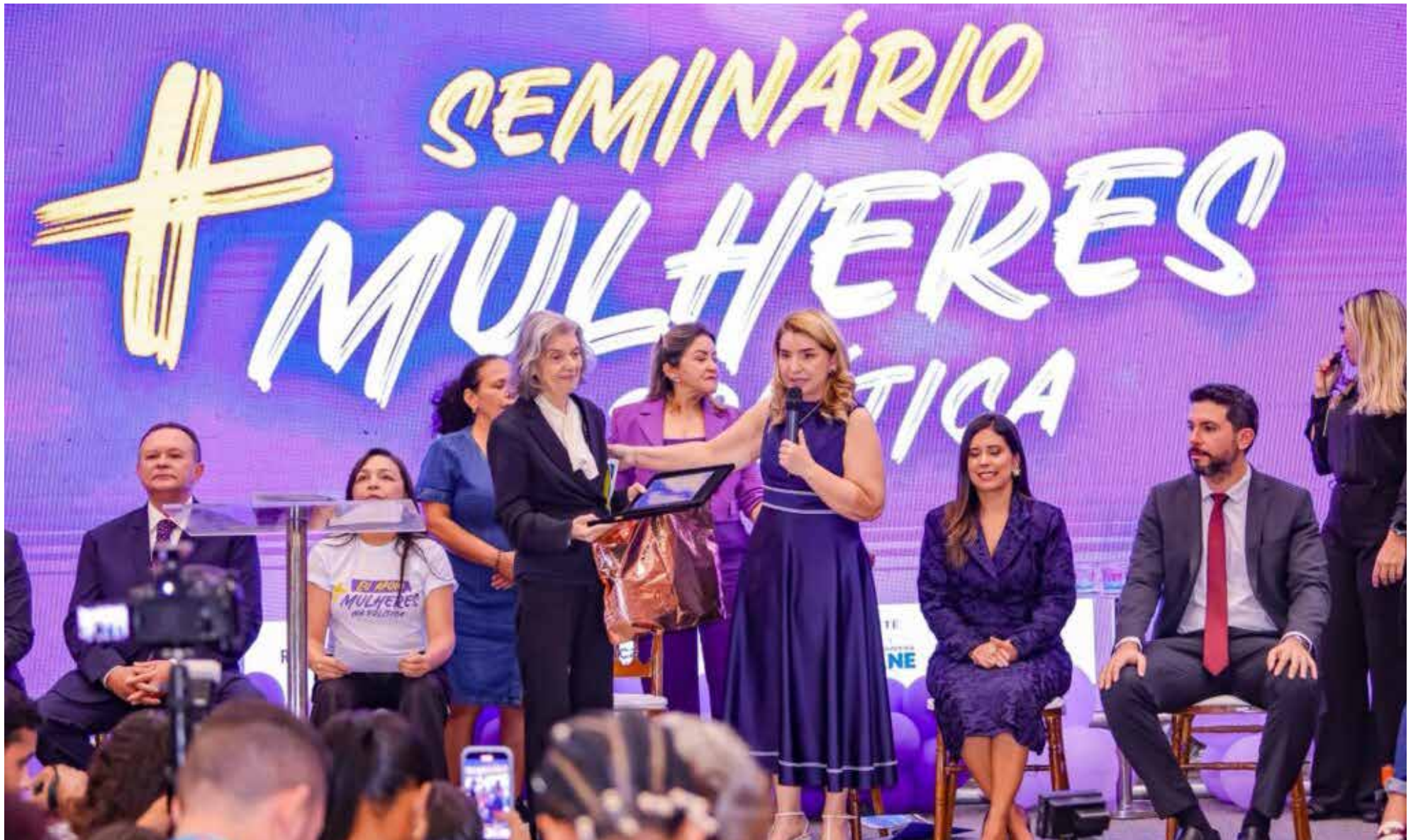
Presidente da Assembleia Legislativa, deputada Iracema Vale, recebe a ministra Cármen Lúcia, no seminário Mais Mulheres na Política