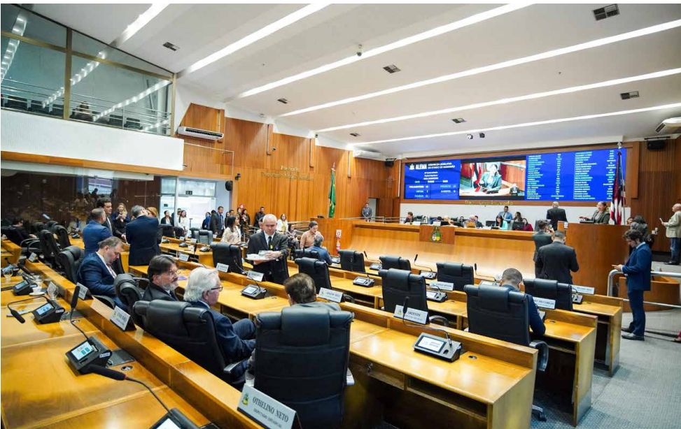
Sessão na qual foi aprovado o PL que altera a lei que reestrutura o Maranhão Solidário

O plenário da Assembleia Legislativa do Maranhão aprovou o Projeto de Lei nº 416/2025, que altera a lei que reestrutura o programa ‘Maranhão Solidário’, do Governo do Estado. A iniciativa visa promover o desenvolvimento social e econômico, assegurando a inclusão de populações em situação de vulnerabilidade.