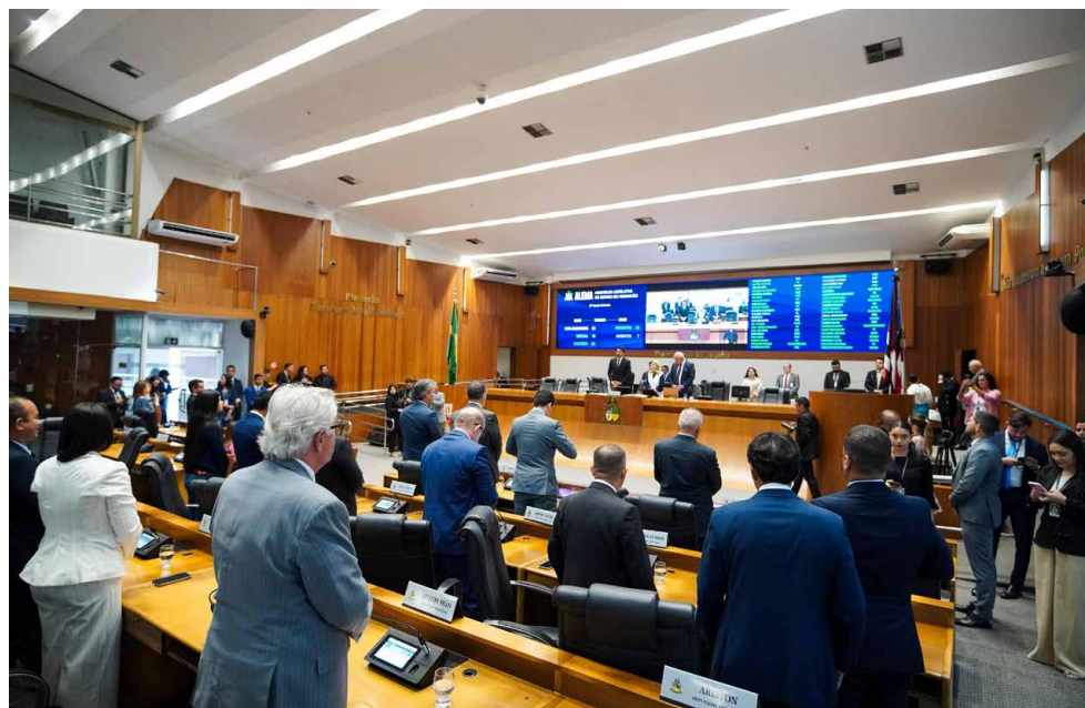
Deputados aprovaram a MP 500/2025, que dispõe sobre o programa Instituição Legal

A Assembleia Legislativa aprovou a Medida Provisória 500/2025 (mensagem nº 067/2025), que dispõe sobre a criação do programa ‘Instituição Legal’ no estado do Maranhão. A matéria segue para promulgação pelo Poder Executivo.