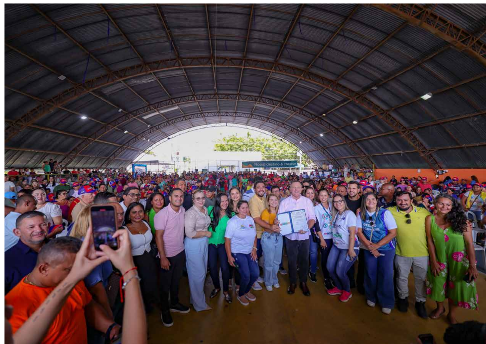
Iracema Vale, governador Carlos Brandão e outras autoridades durante ato em Barreirinhas

“Estamos levando dignidade, saúde e oportunidades para as famílias maranhenses. Esse programa é um exemplo de como a união entre Governo, Assembleia e municípios transforma vidas e fortalece nossa rede de assistência social”, destacou Brandão.