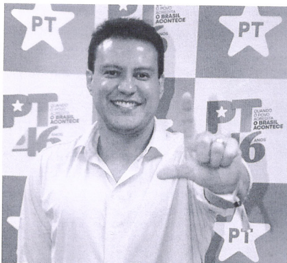
Vice-governador do MA, Felipe Camarão (PT)

Portanto, a primeira questão a ser decidida é que o Requerimento nº 089/2026 é datado de 19/03/2026, sendo que a primeira notícia que teria fundamentado a sua existência é do dia seguinte, dia 20/03/2026. Assim, tem-se que o Requerimento de CPI não tem por fundamento notícia da imprensa, mas sim fonte primária de informação, que seria vazamento ilícito de informações de procedimento SIGILOSO da Procuradoria Geral de Justiça. Dessa forma, a proposição tem como fonte PROVA ILÍCITA , inconstitucional. Pior que isso, prova obtida mediante crime, no caso previsto no art. 325 do Código Penal e/ou do art. 10, da Lei nº 9.296/96: